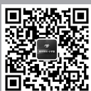
《教学月刊·小学版》 微信公众号二维码