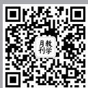
教学月刊微信 公众号二维码