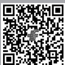
《教学月刊·小学版》 (语文)邮政订阅二维码